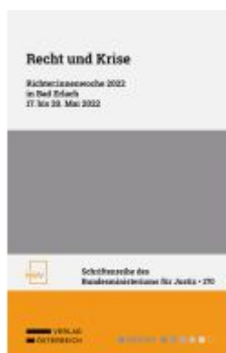
Recht und Krise Ladenpreis: 48,00EUR