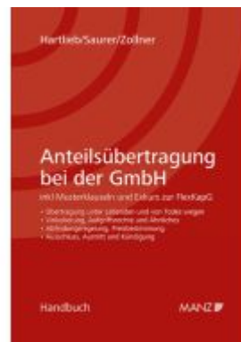
Anteilsübertragung bei der GmbH Ladenpreis: 132,00EUR

Alle Preise inkl. MwSt. zzgl. Versand. Bei Bestellung im LexisNexis Onlineshop kostenloser Versand innerhalb Österreichs.