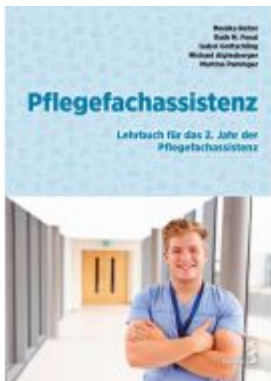
Pflegefachassistenz Ladenpreis: 42,90EUR

Wir haben andere Produkte gefunden, die Ihnen gefallen könnten!