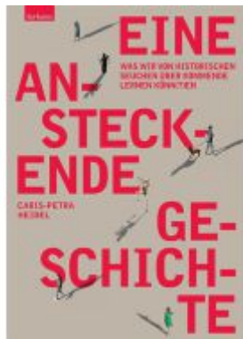
Eine ansteckende Geschichte Ladenpreis: 25,50EUR