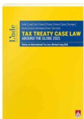
Tax Treaty Case Law around the Globe 2021 Ladenpreis: 90,00EUR