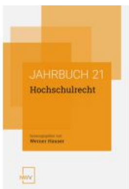
Hochschulrecht Ladenpreis: 68,00EUR