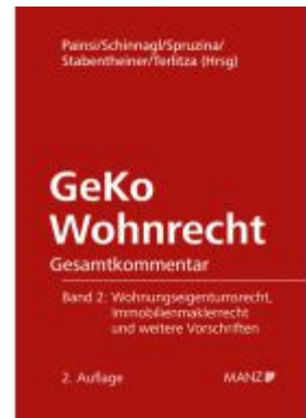
GeKo Wohnrecht Gesamtkommentar Band 2 Wohnungseigentumsgesetz Ladenpreis: 248,00EUR