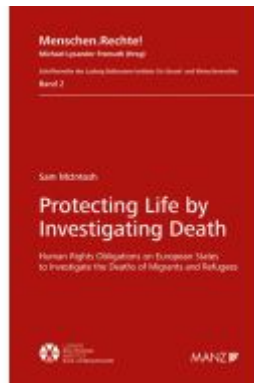
Protecting Life by Investigating Death Ladenpreis: 84,00EUR