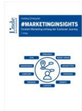
#marketinginsights Ladenpreis: 39,00EUR