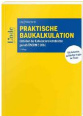
Praktische Baukalkulation Ladenpreis: 64,00EUR

Wir haben andere Produkte gefunden, die Ihnen gefallen könnten!