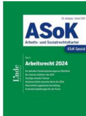
ASoK-Spezial Arbeitsrecht 2024 Ladenpreis: 30,00EUR