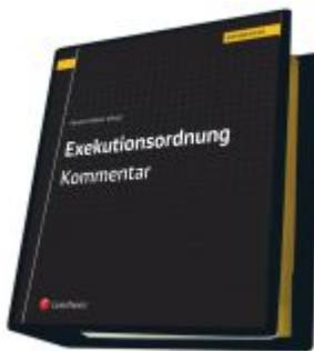
Exekutionsordnung - Kommentar Ladenpreis: 748,00EUR