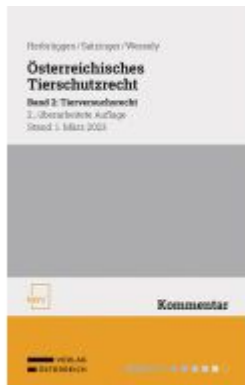
Österreichisches Tierschutzrecht Ladenpreis: 88,00EUR