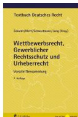
Wettbewerbsrecht, Gewerblicher Rechtsschutz und Urheberrecht Ladenpreis: 34,00EUR