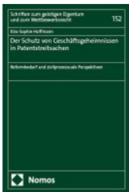
Der Schutz von Geschäftsgeheimnissen in Patentstreitsachen Ladenpreis: 117,20EUR