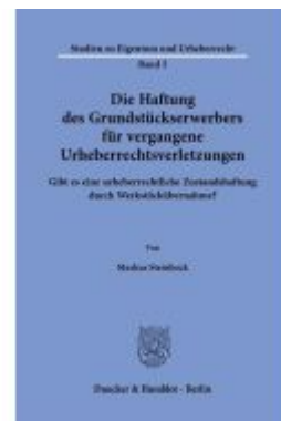
Die Haftung des Grundstückserwerbers für vergangene Urheberrechtsverletzungen. Ladenpreis: 82,20EUR