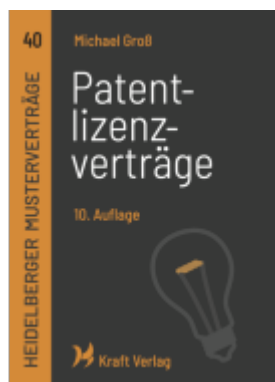
Patentlizenzverträge Ladenpreis: 15,20EUR