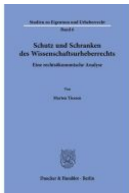
Schutz und Schranken des Wissenschaftsurheberrechts. Ladenpreis: 102,70EUR