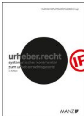
urheber.recht Ladenpreis: 368,00EUR

Wir haben andere Produkte gefunden, die Ihnen gefallen könnten!