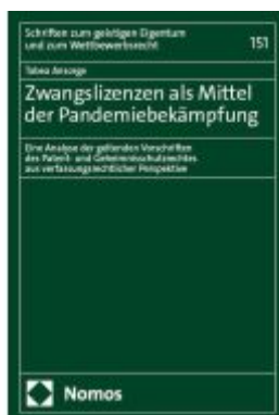
Zwangslizenzen als Mittel der Pandemiebekämpfung Ladenpreis: 91,50EUR