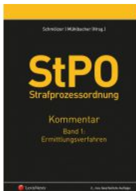
StPO Strafprozessordnung - Kommentar Band 1: Ermittlungsverfahren Ladenpreis: 292,00 EUR

Wir haben andere Produkte gefunden, die Ihnen gefallen könnten!