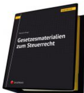
Gesetzesmaterialien zum Steuerrecht Ladenpreis: 160,00 EUR