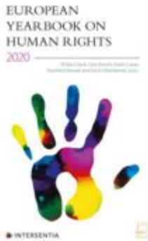
European Yearbook on Human Rights 2020 Ladenpreis: 95,00 EUR