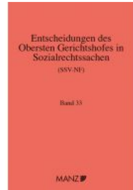
Entscheidungen des obersten Gerichtshofes in Sozialrechtssachen SSV- NF Ladenpreis: 139,20 EUR