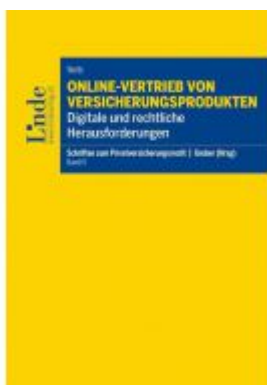
Online-Vertrieb von Versicherungsprodukten Ladenpreis: 36,00 EUR