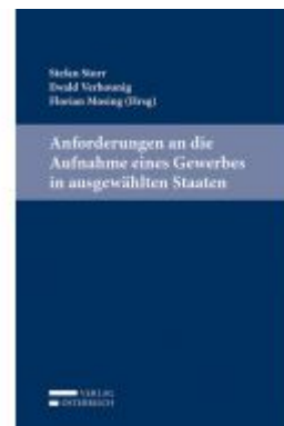
Anforderungen an die Aufnahme eines Gewerbes in ausgewählten Staaten Ladenpreis: 64,00 EUR