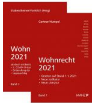
PAKET: Wohnrecht 2021 Band 1 + 2 Ladenpreis: 74,00 EUR