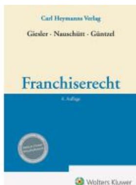
Franchiserecht Ladenpreis: 173,80EUR