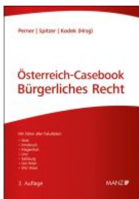
Österreich-Casebook Bürgerliches Recht Ladenpreis: 67,20EUR