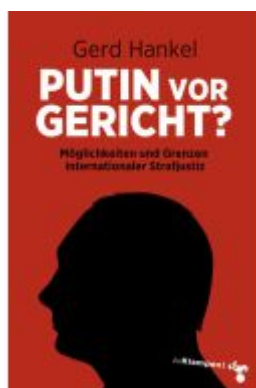
Putin vor Gericht? Ladenpreis: 14,40EUR