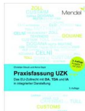
Praxisfassung UZK to go Ladenpreis: 45,20EUR