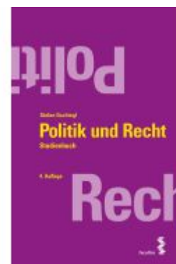
Politik und Recht Ladenpreis: 19,60EUR