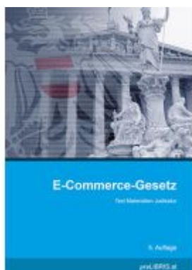
E-Commerce-Gesetz Ladenpreis: 23,00EUR