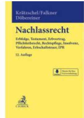
Nachlassrecht Ladenpreis: 132,70EUR