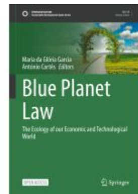
Blue Planet Law Ladenpreis: 54,99EUR