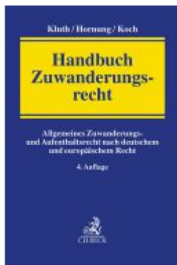
Handbuch Zuwanderungsrecht Ladenpreis: 184,10EUR