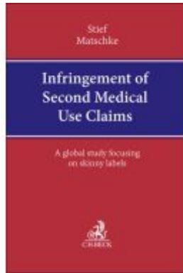
Infringement of Second Medical Use Claims Ladenpreis: 173,80EUR