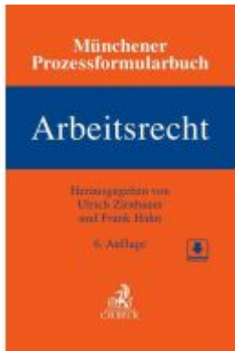
Münchener Prozessformularbuch Bd. 6: Arbeitsrecht Ladenpreis: 194,30EUR