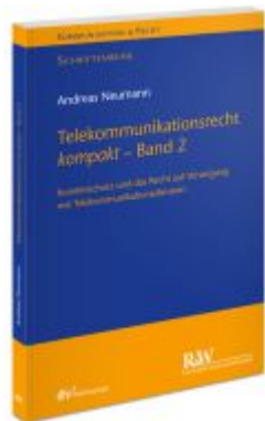
Telekommunikationsrecht kompakt - Band 2 Ladenpreis: 35,90EUR