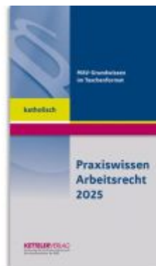
Praxiswissen Arbeitsrecht 2025 katholisch Ladenpreis: 13,30EUR