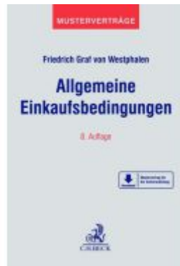
Allgemeine Einkaufsbedingungen Ladenpreis: 71,00EUR