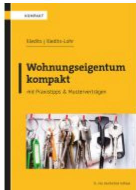
Wohnungseigentum kompakt Ladenpreis: 46,00EUR