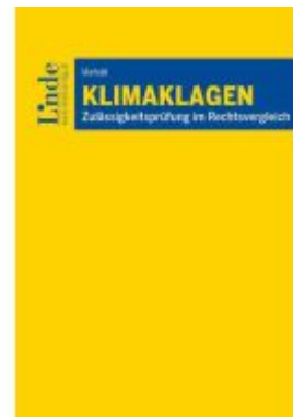
Klimaklagen Ladenpreis: 38,00EUR