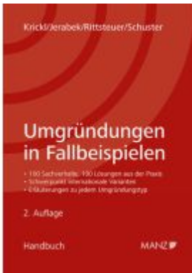
Umgründungen in Fallbeispielen Ladenpreis: 74,00EUR