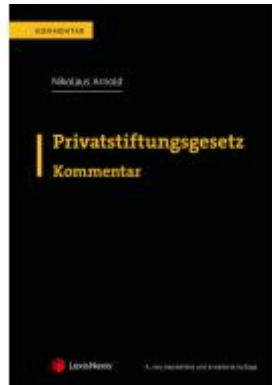
Privatstiftungsgesetz Ladenpreis: 239,00EUR