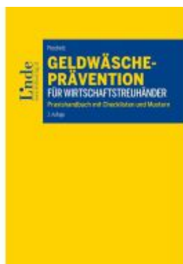
Geldwäscheprävention für Wirtschaftstreuhandler Ladenpreis: 34,00EUR