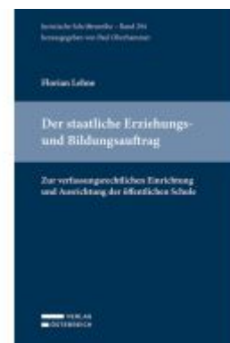
Der staatliche Erziehungs- und Bildungsauftrag Ladenpreis: 72,00EUR