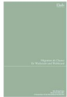
Migration als Chance für Wachstum und Wohlstand Ladenpreis: 48,00EUR