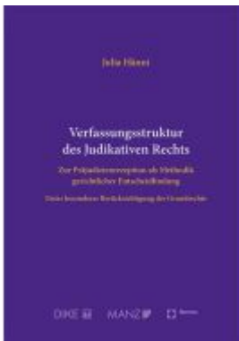
Verfassungsstruktur des Judikativen Rechts Ladenpreis: 99,00EUR

Wir haben andere Produkte gefunden, die Ihnen gefallen könnten!