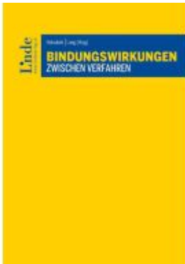
Bindungswirkungen zwischen Verfahren Ladenpreis: 125,00EUR