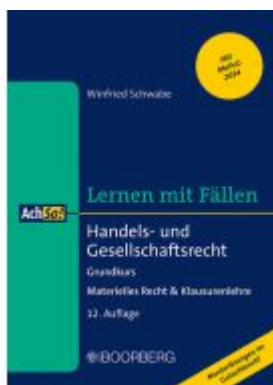
Handels- und Gesellschaftsrecht Ladenpreis: 22,10EUR