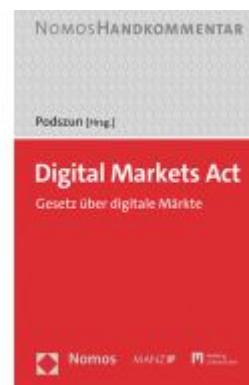
Digital Markets Act Ladenpreis: 134,00EUR