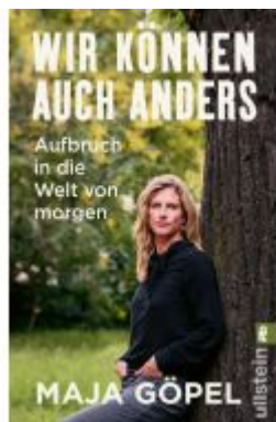
Wir können auch anders Ladenpreis: 14,40EUR

Wir haben andere Produkte gefunden, die Ihnen gefallen könnten!