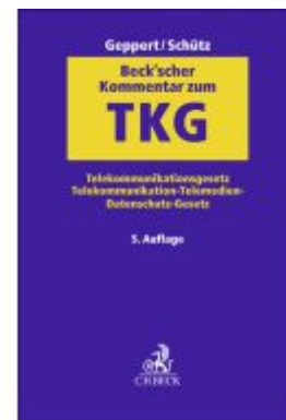
Beck'scher Kommentar zum TKG Ladenpreis: 338,30EUR