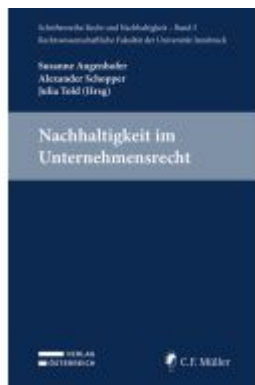
Nachhaltigkeit im Unternehmensrecht Ladenpreis: 59,00EUR