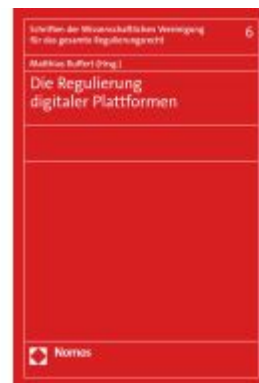
Die Regulierung digitaler Plattformen Ladenpreis: 50,40EUR