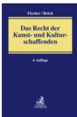
Das Recht der Kunst- und Kulturschaffenden Ladenpreis: 81,30EUR