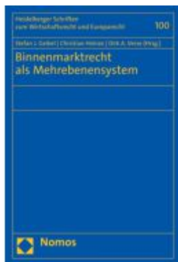
Binnenmarktrecht als Mehrebenensystem Ladenpreis: 96,70EUR