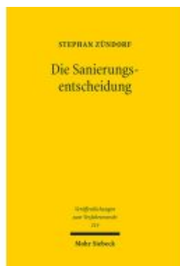
Die Sanierungsentscheidung Ladenpreis: 133,70EUR