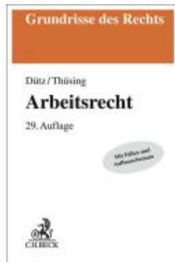
Arbeitsrecht Ladenpreis: 35,90EUR