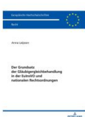
Der Grundsatz der Gläubigergleichbehandlung in der EuInsVO und nationalen Rechtsordnungen Ladenpreis: 51,40EUR