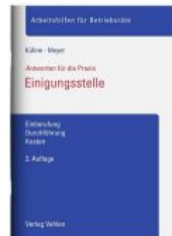
Einigungsstelle Ladenpreis: 21,50EUR