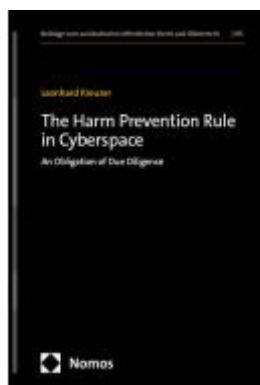
The Harm Prevention Rule in Cyberspace Ladenpreis: 112,10EUR