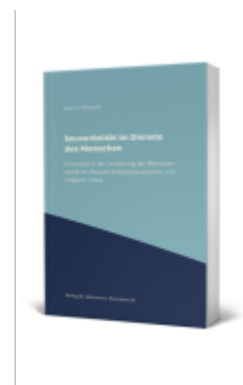
Souveränität im Dienste des Menschen Ladenpreis: 97,70EUR