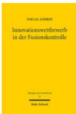
Innovationswettbewerb in der Fusionskontrolle Ladenpreis: 101,80EUR