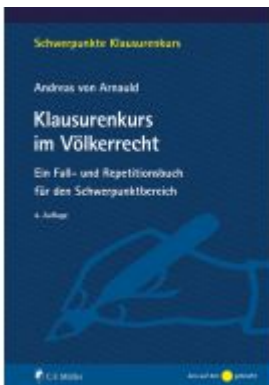
Klausurenkurs im Völkerrecht Ladenpreis: 27,80EUR