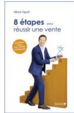
8 étapes pour réussir une vente Ladenpreis: 28,90 EUR