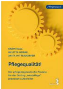
Pflegequalität! Ladenpreis: 18,90 EUR

Wir haben andere Produkte gefunden, die Ihnen gefallen könnten!