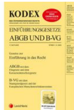
KODEX Einführungsgesetze ABGB und B-VG 2020/21 Ladenpreis: 15,00 EUR