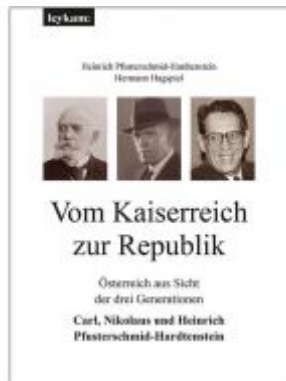
Vom Kaiserreich zur Republik Ladenpreis: 49,00 EUR