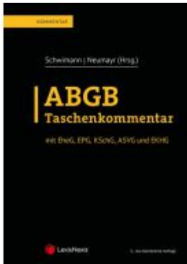
ABGB Taschenkommentar Aktionspreis: 249,00 EUR Ladenpreis: 319,00 EUR