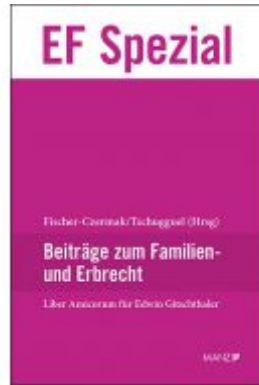
Liber Amicorum Edwin Gitschthaler Ladenpreis: 74,00 EUR