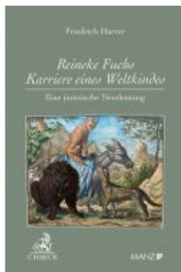
Reineke Fuchs - Karriere eines Weltkindes Eine juristische Neudeutung Ladenpreis: 19,00 EUR