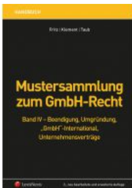
Mustersammlung zum GmbH-Recht / Mustersammlung zum GmbH-Recht, Band IV - Beendigung, Umgründung, "GmbH" international, Unternehmensverträge Ladenpreis: 299,00 EUR