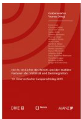
Die EU im Lichte des Brexits und der Wahlen Europaparechtstag 2019 Ladenpreis: 58,00 EUR