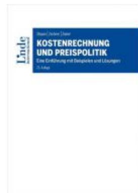
Kostenrechnung und Preispolitik Ladenpreis: 42,00 EUR