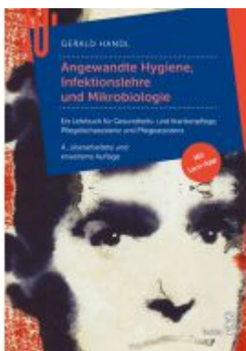
Angewandte Hygiene Ladenpreis: 31,90 EUR