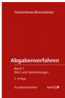
Abgabenverfahren Ladenpreis: 168,00 EUR