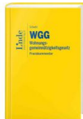
WGG I Wohnungsgemeinnützigkeitsgesetz Ladenpreis: 79,00 EUR