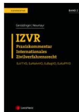
IZVR Praxiskommentar Internationales Zivilverfahrensrecht Ladenpreis: 139,00 EUR