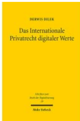
Das Internationale Privatrecht digitaler Werte Ladenpreis: 86,40EUR