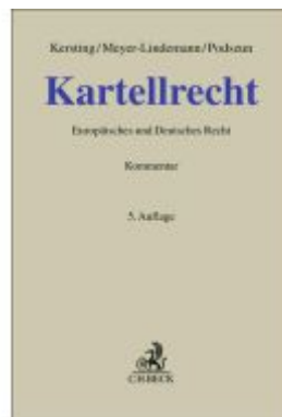
Kartellrecht Ladenpreis: 410,20EUR