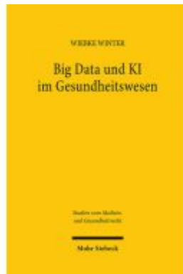
Big Data und KI im Gesundheitswesen Ladenpreis: 81,30EUR