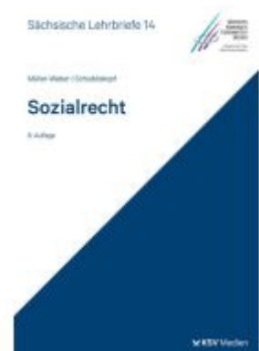
Sozialrecht (SL 14) Ladenpreis: 25,70EUR