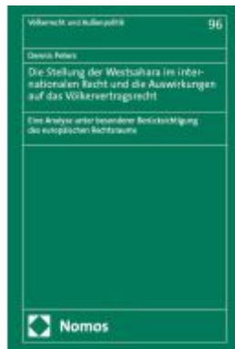
Die Stellung der Westsahara im internationalen Recht und die Auswirkungen auf das Völkervertragsrecht Ladenpreis: 204,60EUR