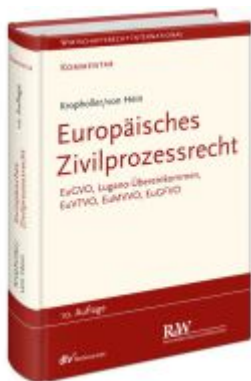
Europäisches Zivilprozessrecht Ladenpreis: 276,60EUR