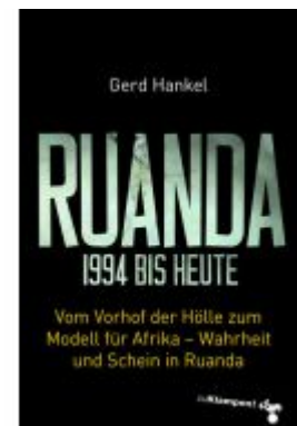
Ruanda 1994 bis heute Ladenpreis: 18,50EUR