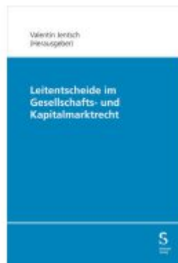
Leitentscheide im Gesellschafts- und Kapitalmarktrecht Ladenpreis: 186,90EUR