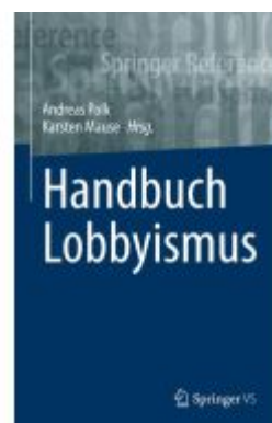
Handbuch Lobbyismus Ladenpreis: 143,91EUR