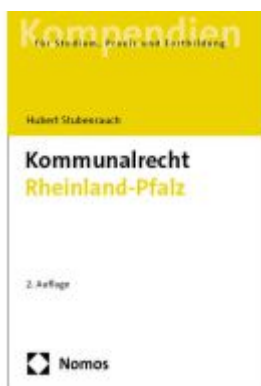
Kommunalrecht Rheinland-Pfalz Ladenpreis: 30,80EUR