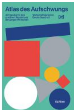
Atlas des Aufschwungs Ladenpreis: 30,70EUR

Wir haben andere Produkte gefunden, die Ihnen gefallen könnten!