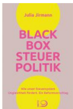
Blackbox Steuerpolitik Ladenpreis: 20,60EUR