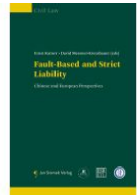
Fault-Based and strict Liability Ladenpreis: 85,00EUR