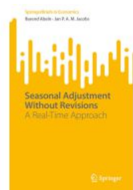
Seasonal Adjustment Without Revisions Ladenpreis: 54,99EUR