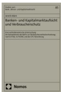
Banken- und Kapitalmarktaufsicht und Verbraucherschutz Ladenpreis: 122,40EUR