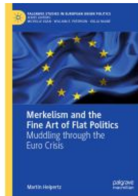
Merkelism and the Fine Art of Flat Politics Ladenpreis: 131,99EUR