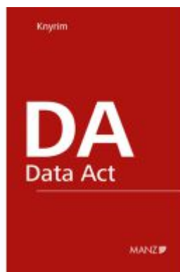
DA - Data Act Ladenpreis: 48,00EUR