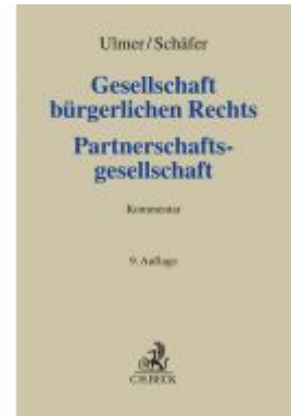
Gesellschaft bürgerlichen Rechts und Partnerschaftsgesellschaft Ladenpreis: 122,40EUR