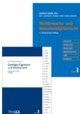
Kombipaket Wettbewerbs- und Immaterialgüterrecht und FlexLex Geistiges Eigentum und Wettbewerb Ladenpreis: 74,00EUR