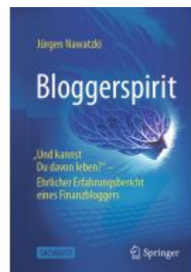
Bloggerspirit Ladenpreis: 30,83EUR