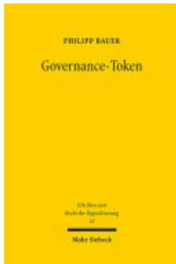
Governance-Token Ladenpreis: 112,10EUR