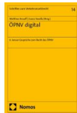
ÖPNV digital Ladenpreis: 35,00EUR