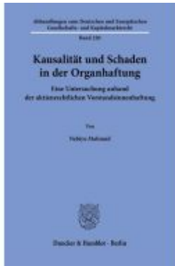
Kausalität und Schaden in der Organhaftung. Ladenpreis: 82,20EUR