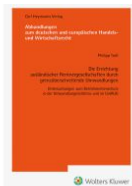
Die Errichtung ausländischer Rentengesellschaften durch grenzüberschreitende Umwandlungen (AHW 261) Ladenpreis: 122,40EUR