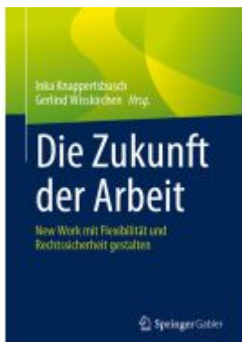
Die Zukunft der Arbeit Ladenpreis: 61,67EUR