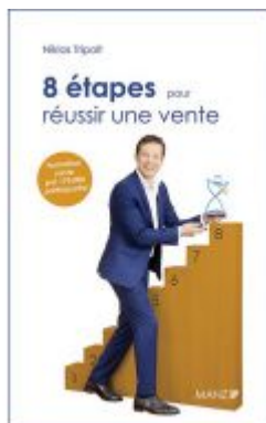
8 étapes pour réussir une vente Ladenpreis: 28,90 EUR