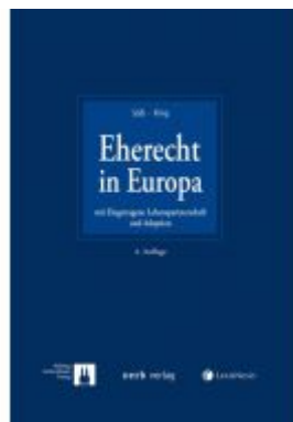
Eherecht in Europa Ladenpreis: 169,00 EUR