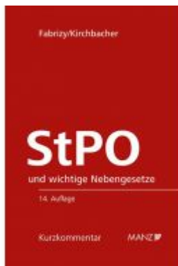
Strafprozessordnung - StPO Ladenpreis: 178,00 EUR

Wir haben andere Produkte gefunden, die Ihnen gefallen könnten!