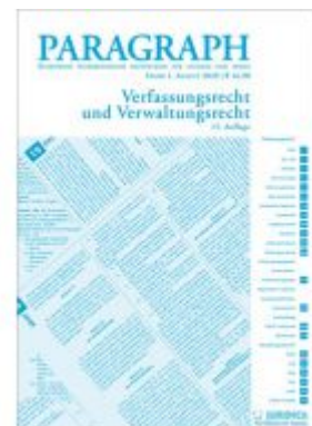
Paragraph - Verfassungs- und Verwaltungsrecht Ladenpreis: 16,90 EUR