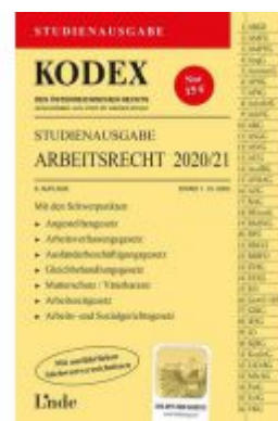
KODEX Studienausgabe Arbeitsrecht 2020/21 Ladenpreis: 15,00 EUR