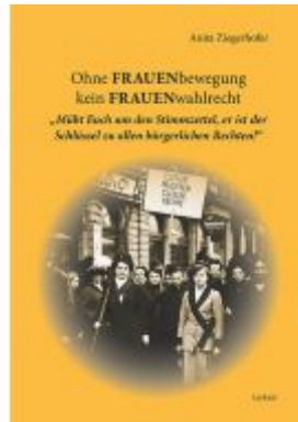
Ohne FRAUENbewegung kein FRAUENwahlrecht Ladenpreis: 17,90 EUR