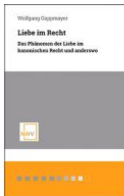
Liebe im Recht Ladenpreis: 48,00 EUR