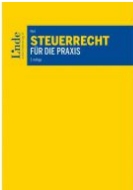
Steuerrecht für die Praxis Ladenpreis: 70,00 EUR