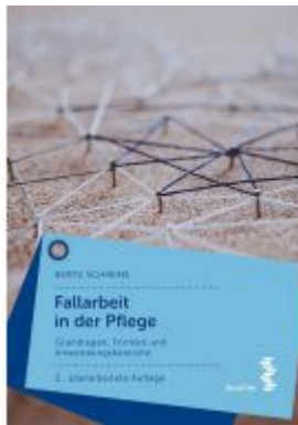
Fallarbeit in der Pflege Ladenpreis: 19,90 EUR