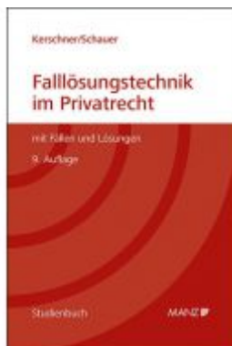
Falllösungstechnik im Privatrecht Mit Fällen und Lösungen Ladenpreis: 39,00 EUR