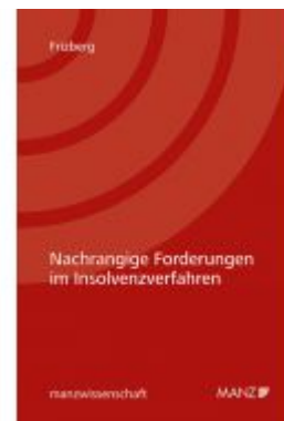
Nachrangige Forderungen im Insolvenzverfahren Ladenpreis: 62,00 EUR