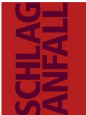
Schlaganfall Ladenpreis: 19,90 EUR