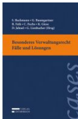
Besonderes Verwaltungsrecht - Fälle und Lösungen Ladenpreis: 33,00 EUR