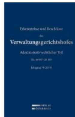
Erkenntnisse und Beschlüsse des Verwaltungsgerichtshofes Ladenpreis: 419,00 EUR