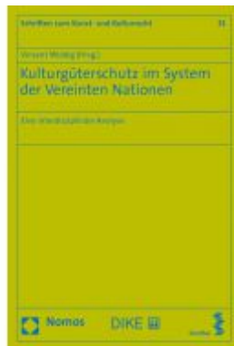
Kulturgüterschutz im System der Vereinten Nationen Ladenpreis: 56,60 EUR