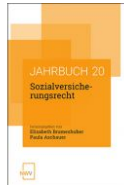
Sozialversicherungsrecht Ladenpreis: 62,00 EUR