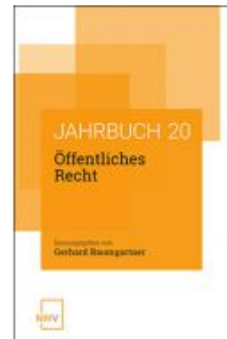
Öffentliches Recht Ladenpreis: 68,00 EUR