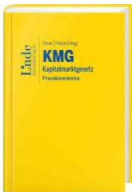
KMG | Kapitalmarktgesetz Ladenpreis: 89,00 EUR