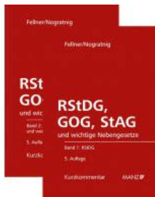
RStDG, GOG und StAG Richter- und StaatsanwaltschaftsdienstG, GerichtsorganisationsG und StaatsanwaltschaftsG Ladenpreis: 298,00 EUR