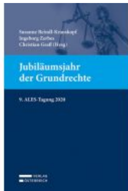
Jubiläumsjahr der Grundrechte Ladenpreis: 49,00 EUR

Wir haben andere Produkte gefunden, die Ihnen gefallen könnten!