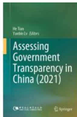
Assessing Government Transparency in China (2021) Ladenpreis: 175,99EUR