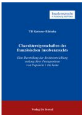
Charaktereigenschaften des französischen Insolvenzrechts Ladenpreis: 102,60EUR