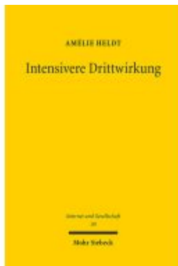
Intensivere Drittwirkung Ladenpreis: 86,40EUR