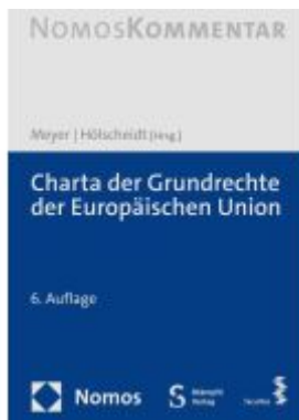
Charta der Grundrechte der Europäischen Union Ladenpreis: 163,50EUR