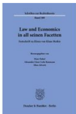
Law and Economics in all seinen Facetten. Ladenpreis: 113,00EUR