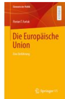
Die Europäische Union Ladenpreis: 25,64EUR