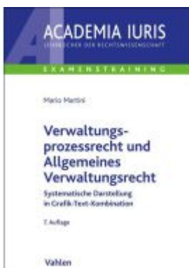
Verwaltungsprozessrecht und Allgemeines Verwaltungsrecht Ladenpreis: 26,70EUR