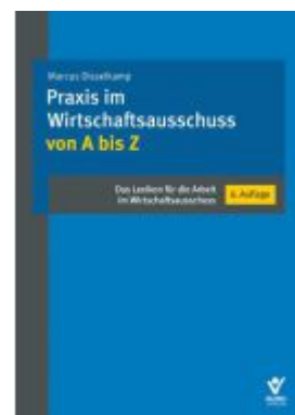
Praxis im Wirtschaftsausschuss von A bis Z Ladenpreis: 57,60EUR