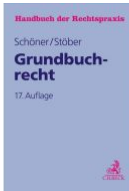
Grundbuchrecht Ladenpreis: 194,30EUR

Wir haben andere Produkte gefunden, die Ihnen gefallen könnten!