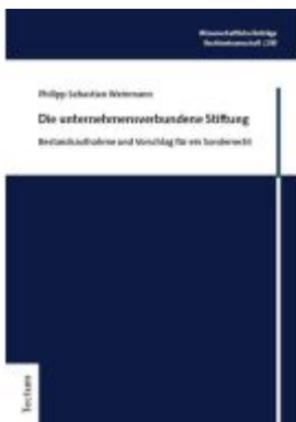
Die unternehmensverbundene Stiftung Ladenpreis: 122,40EUR