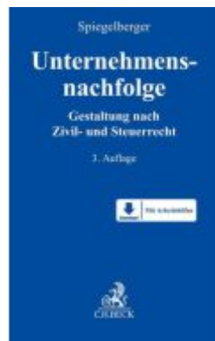
Unternehmensnachfolge Ladenpreis: 142,90EUR