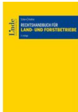
Rechtshandbuch für Land- und Forstbetriebe Ladenpreis: 58,00EUR