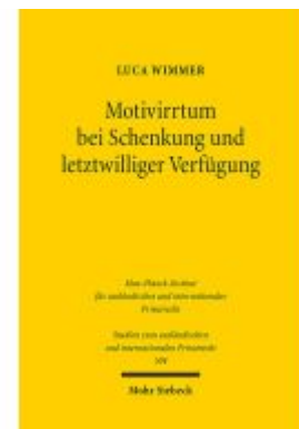
Motivirrtum bei Schenkung und letztwilliger Verfügung Ladenpreis: 76,10EUR