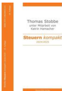
Steuern kompakt 2024-2025 Ladenpreis: 18,50EUR