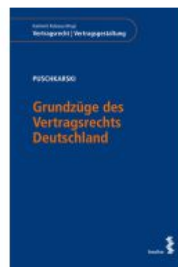
Grundzüge des Vertragsrechts Deutschland Ladenpreis: 64,00EUR