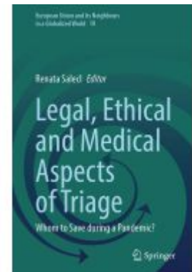
Legal, Ethical and Medical Aspects of Triage Ladenpreis: 186,99EUR