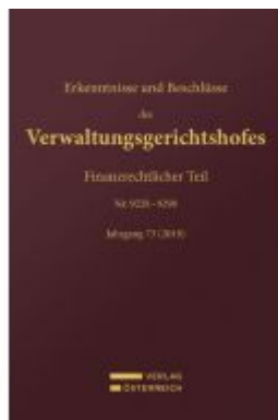
Erkenntnisse und Beschlüsse des Verwaltungsgerichtshofes Ladenpreis: 148,00 EUR