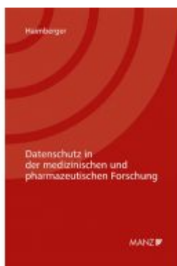
Datenschutz in der medizinischen und pharmazeutischen Forschung Ladenpreis: 64,00 EUR