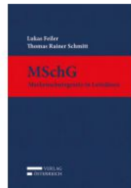
MSchG Ladenpreis: 169,00 EUR