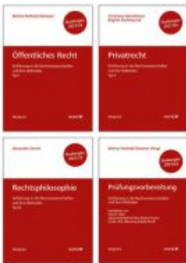
PAKET: Prüfungsvorbereitung + Einführung in die Rechtswissenschaften und ihre Methoden: TI. I + TI. II + TI. III Ladenpreis: 44,00 EUR