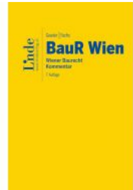
BauR Wien | Wiener Baurecht Ladenpreis: 120,00 EUR