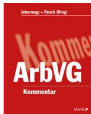
Kommentar zum Arbeitsverfassungsgesetz Ladenpreis: 188,00 EUR