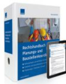
Rechtshandbuch Planungs- und Baustellenkoordination Ladenpreis: 239,80EUR