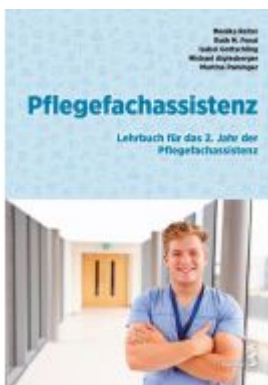
Pflegefachassistenz Ladenpreis: 42,90EUR