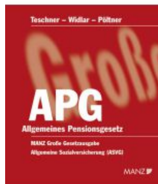
Allgemeines Pensionsgesetz Ladenpreis: 34,00EUR