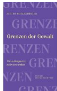
Grenzen der Gewalt Ladenpreis: 16,50EUR