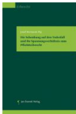
Die Schenkung auf den Todesfall und ihr Spannungsverhältnis zum Pflichtteilsrecht Ladenpreis: 98,00EUR