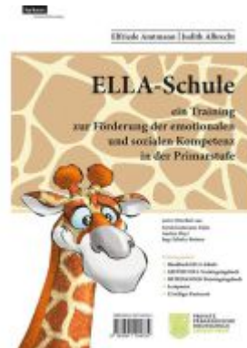
ELLA - Schule - ein Training zur Förderung der emotionalen und sozialen Kompetenz in der Primarstufe Ladenpreis: 42,00EUR