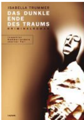
Das dunkle Ende des Traums Ladenpreis: 19,90 EUR