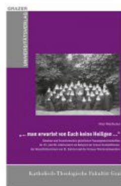
"... man erwartet von Euch keine Heiligen ..." Ladenpreis: 39,90 EUR