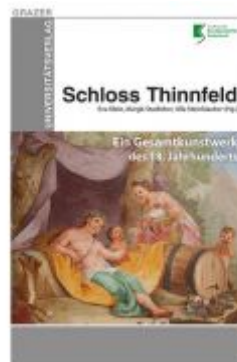
Schloss Thinnfeld Ladenpreis: 22,00 EUR