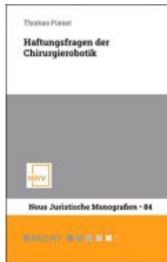
Haftungsfragen der Chirurgierobotik Ladenpreis: 54,00 EUR