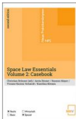
Space Law Essentials Ladenpreis: 19,00 EUR