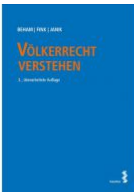
Völkerrecht verstehen Ladenpreis: 34,00 EUR