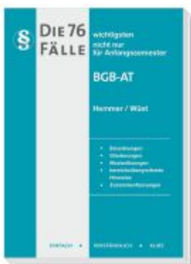
Die 76 wichtigsten Fälle BGB AT Ladenpreis: 16,40EUR