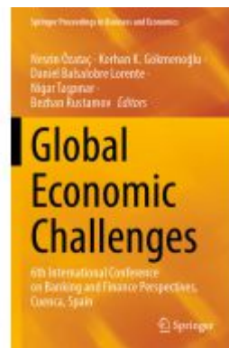
Global Economic Challenges Ladenpreis: 186,99EUR