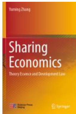
Sharing Economics Ladenpreis: 131,99EUR

Wir haben andere Produkte gefunden, die Ihnen gefallen könnten!