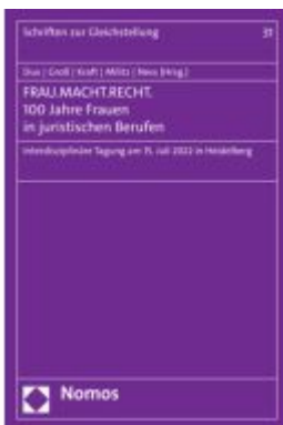
FRAU.MACHT.RECHT. 100 Jahre Frauen in juristischen Berufen Ladenpreis: 86,40EUR