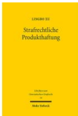
Strafrechtliche Produkthaftung Ladenpreis: 71,00EUR