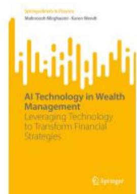
AI Technology in Wealth Management Ladenpreis: 49,49EUR