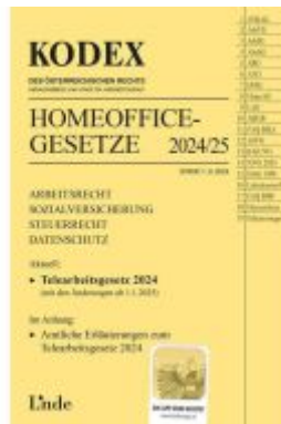
KODEX Homeoffice-Gesetze 2024/25 Ladenpreis: 20,00EUR