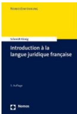
Introduction à la langue juridique française Ladenpreis: 30,80EUR