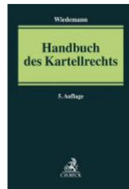
Handbuch des Kartellrechts Ladenpreis: 400,00EUR