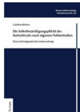
Die Selbstbeziehungspflicht des Aufsichtsrats nach eigenem Fehlverhalten Ladenpreis: 81,30EUR