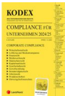
KODEX Compliance für Unternehmen 2024/25 - inkl. App Ladenpreis: 81,00EUR