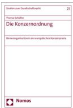
Die Konzernordnung Ladenpreis: 117,20EUR

Wir haben andere Produkte gefunden, die Ihnen gefallen könnten!