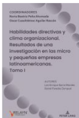
Habilidades directivas y clima organizacional. Resultados de una investigación en las micro y pequeñas empresas latinoamericanas Ladenpreis: 78,80EUR