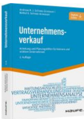
Unternehmensverkauf Ladenpreis: 51,40EUR