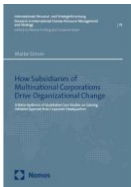
How Subsidiaries of Multinational Corporations Drive Organizational Change Ladenpreis: 60,70EUR