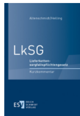
LkSG Ladenpreis: 76,10EUR