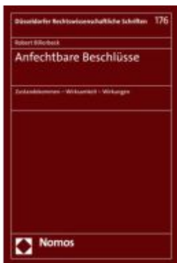
Anfechtbare Beschlüsse Ladenpreis: 168,60EUR