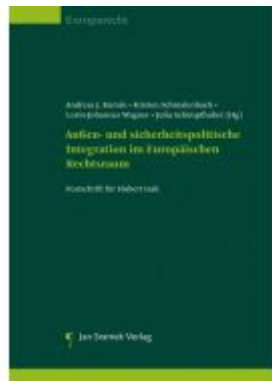
Außen- und sicherheitspolitische Integration im Europäischen Rechtsraum Ladenpreis: 128,00 EUR