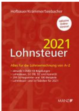
Lohnsteuer 2021 Ladenpreis: 59,00 EUR