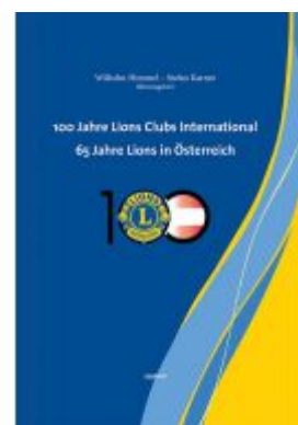
100 Jahre Lions Clubs International. 65 Jahre Lions in Österreich Ladenpreis: 29,90 EUR