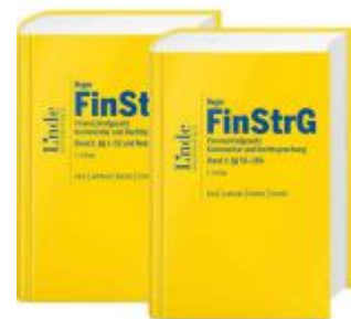
FinStrG | Finanzstrafgesetz - Paket Bd. 1+2 Ladenpreis: 348,00 EUR