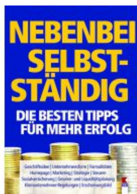
Nebenbei selbstständig. Die besten Tipps für mehr Erfolg Ladenpreis: 19,90 EUR