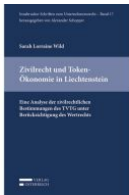
Zivilrecht und Token-Ökonomie in Liechtenstein Ladenpreis: 39,00 EUR