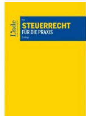
Steuerrecht für die Praxis Ladenpreis: 70,00 EUR