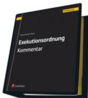
Exekutionsordnung - Kommentar Ladenpreis: 623,00 EUR