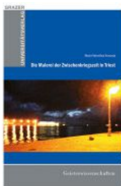
Die Malerei der Zwischenkriegszeit in Triest Ladenpreis: 39,90 EUR