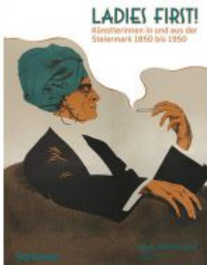
Ladies First! Künstlerinnen in und aus der Steiermark 1850–1950 Ladenpreis: 30,00 EUR