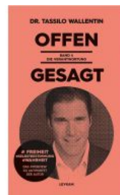
Offen gesagt Band 4 - Die Verantwortung Ladenpreis: 19,80 EUR