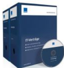
Mustersammlung IT-Verträge Ladenpreis: 207,90 EUR