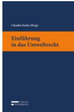
Einführung in das Umweltrecht Ladenpreis: 28,00 EUR