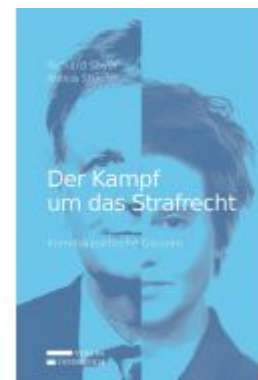
Der Kampf um das Strafrecht Ladenpreis: 25,00 EUR