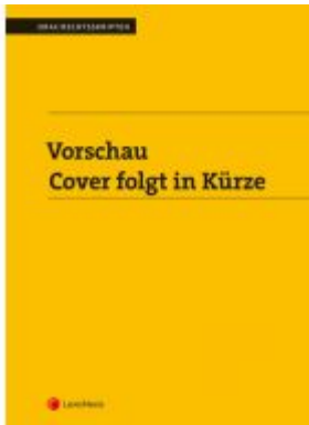
PAKET Edition Zivilrecht PLUS Ladenpreis: 143,00 EUR