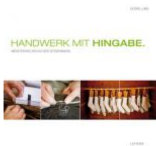
Handwerk mit Hingabe Ladenpreis: 25,00 EUR

Wir haben andere Produkte gefunden, die Ihnen gefallen könnten!