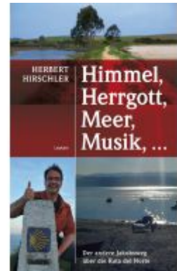
Himmel, Herrgott, Meer, Musik, ... Ladenpreis: 21,00 EUR