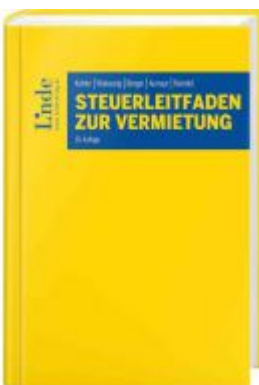
Steuerleitfaden zur Vermietung