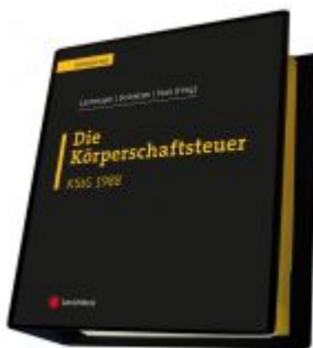
Die Körperschaftsteuer (KStG 1988) Ladenpreis: 410,00 EUR