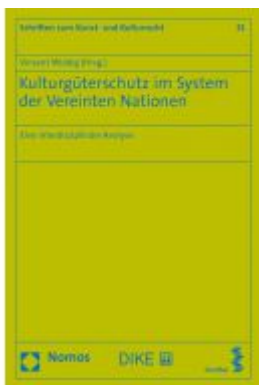
Kulturgüterschutz im System der Vereinten Nationen