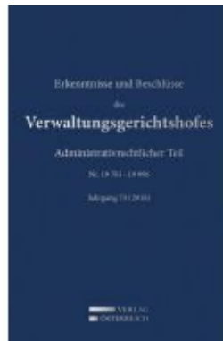
Erkenntnisse und Beschlüsse des Verwaltungsgerichtshofes Ladenpreis: 476,00 EUR