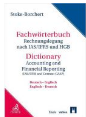
Fachwörterbuch Rechnungslegung nach IAS/IFRS und HGB Ladenpreis: 189,00 EUR