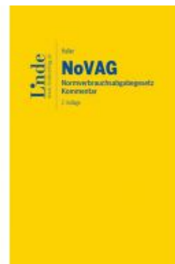
NoVAG | Normverbrauchsabgabegesetz