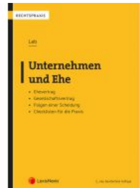
Unternehmen und Ehe Ladenpreis: 39,00 EUR