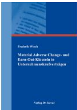
Material Adverse Change- und Earn-Out-Klauseln in Unternehmenskaufverträgen Ladenpreis: 91,40EUR