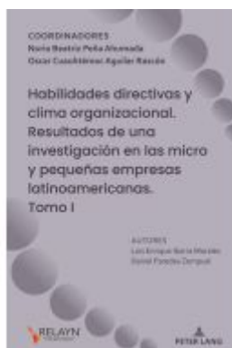
Habilidades directivas y clima organizacional. Resultados de una investigación en las micro y pequeñas empresas latinoamericanas Ladenpreis: 78,80EUR