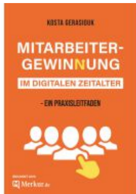
Mitarbeitergewinnung im digitalen Zeitalter Ladenpreis: 25,70EUR