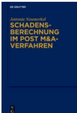
Schadensberechnung im Post M&A-Verfahren Ladenpreis: 99,95EUR