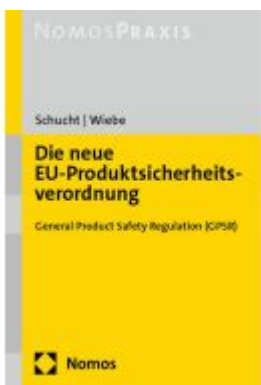
Die neue EU-Produktsicherheitsverordnung Ladenpreis: 50,40EUR