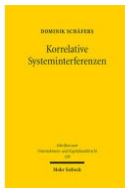
Korrelative Systeminterferenzen Ladenpreis: 153,20EUR