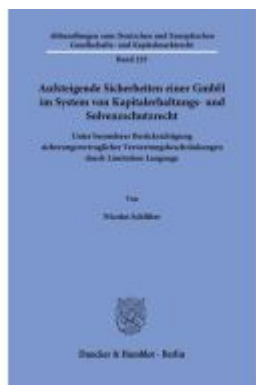
Aufsteigende Sicherheiten einer GmbH im System von Kapitalerhaltungs- und Solvenzschutzrecht. Ladenpreis: 123,30EUR