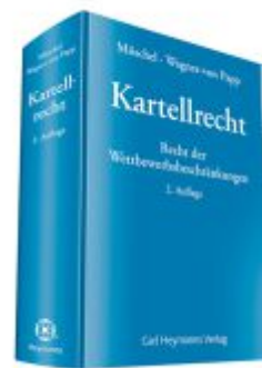
Kartellrecht Ladenpreis: 172,80EUR