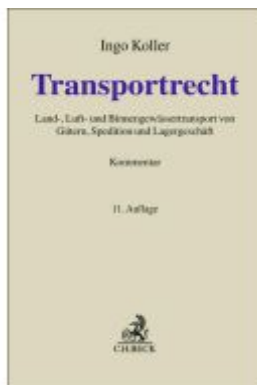
Transportrecht Ladenpreis: 204,60EUR