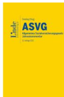
ASVG | Allgemeines Sozialversicherungsgesetz 2022 Ladenpreis: 178,00EUR