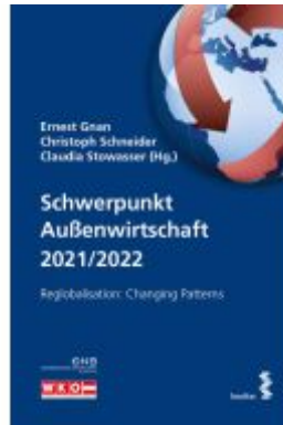
Schwerpunkt Außenwirtschaft 2021/2022 Ladenpreis: 19,80EUR