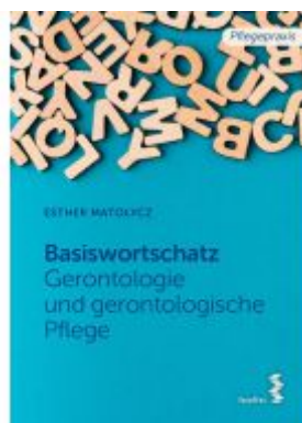
Basiswortschatz Gerontologie und gerontologische Pflege Ladenpreis: 18,90EUR