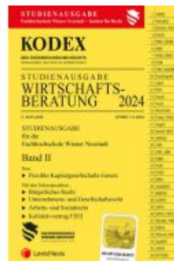
KODEX Wirtschaftsberatung 2024 Band II - inkl. App Ladenpreis: 22,00EUR