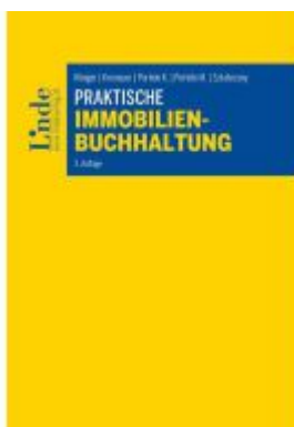
Praktische Immobilienbuchhaltung Ladenpreis: 72,00EUR