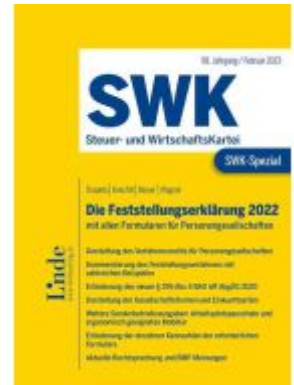
SWK-Spezial Die Feststellungserklärung 2022 Ladenpreis: 49,00EUR