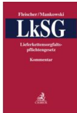
LkSG Ladenpreis: 142,90EUR