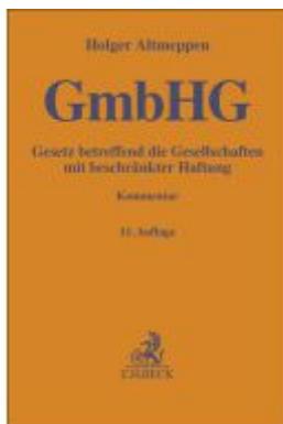
Gesetz betreffend die Gesellschaften mit beschränkter Haftung Ladenpreis: 153,20EUR

Zivilrechtliche Schriften Beiträge zum Wirtschafts-, Handels- und Arbeitsrecht Herausgegeben von Antonia Claviez-Rossi, Alois Lauer und Herbert Oehler Regelredaktion: Herbert Oehler