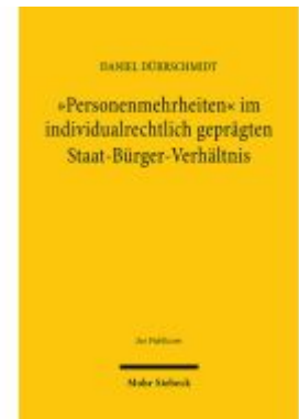
"Personenmehrheiten" im individualrechtlich geprägten Staat-Bürger- Verhältnis Ladenpreis: 164,50EUR