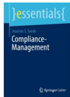
Compliance-Management Ladenpreis: 15,41EUR