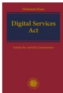
Digital Services Act Ladenpreis: 287,90EUR