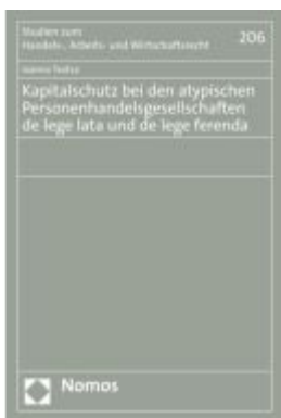
Kapitalschutz bei den atypischen Personenhandelsgesellschaften de lege lata und de lege ferenda Ladenpreis: 71,00EUR