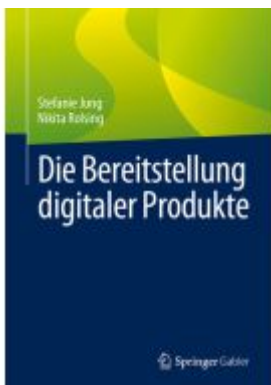
Die Bereitstellung digitaler Produkte Ladenpreis: 56,53EUR