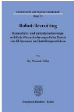
Robot-Recruiting. Ladenpreis: 102,70EUR