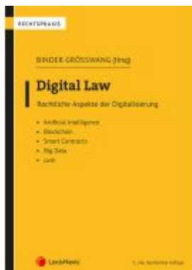
Digital Law Ladenpreis: 62,00EUR