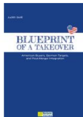
Blueprint of a Takeover Ladenpreis: 46,20EUR