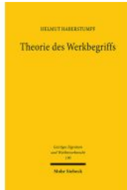
Theorie des Werkbegriffs Ladenpreis: 132,70EUR