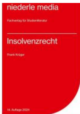
Insolvenzrecht - 2024 Ladenpreis: 17,40EUR