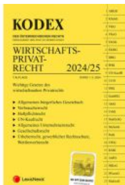
KODEX Wirtschaftsprivatrecht 2024/25 - inkl. App Ladenpreis: 33,00EUR

Wir haben andere Produkte gefunden, die Ihnen gefallen könnten!