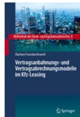
Vertragsanbahnungs- und Vertragsabrechnungsmodelle im Kfz- Leasing Ladenpreis: 123,35EUR