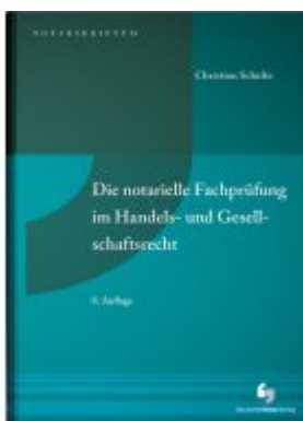
Die notarielle Fachprüfung im Handels- und Gesellschaftsrecht Ladenpreis: 55,60EUR