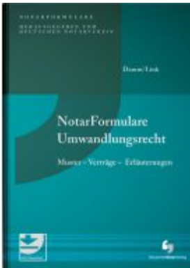
Notarformulare Umwandlungsrecht Ladenpreis: 101,80EUR