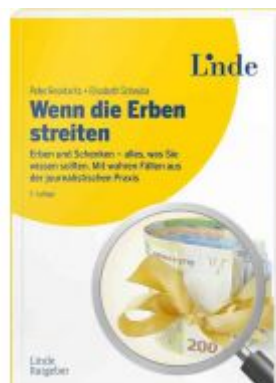
Wenn die Erben streiten Ladenpreis: 24,90 EUR