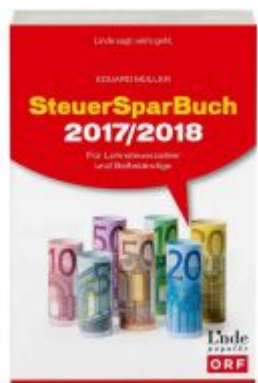
SteuerSparBuch 2017/2018 Ladenpreis: 29,90 EUR