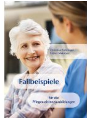
Fallbeispiele Ladenpreis: 19,90 EUR