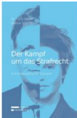
Der Kampf um das Strafrecht Ladenpreis: 25,00 EUR