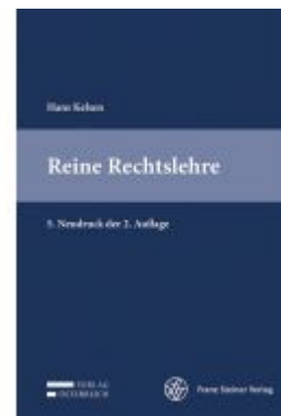
Reine Rechtslehre Ladenpreis: 79,00 EUR