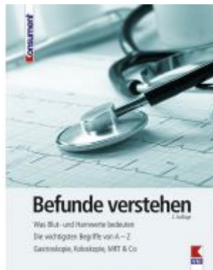
Befunde verstehen Ladenpreis: 19,90 EUR