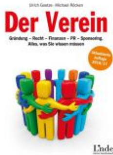
Der Verein Ladenpreis: 12,90 EUR