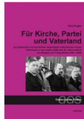
Für Kirche, Partei und "Vaterland" Ladenpreis: 19,90 EUR