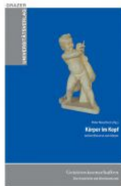
Körper im Kopf Ladenpreis: 24,90 EUR