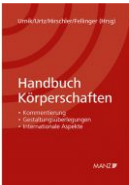
Handbuch Körperschaften Ladenpreis: 128,00 EUR