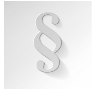
Rechtshandbuch Kinder- und Jugendschutz Ladenpreis: 207,90 EUR