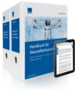
Handbuch für Gesundheitseinrichtungen Ladenpreis: 207,90 EUR