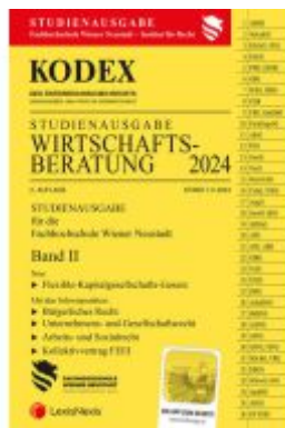
KODEX Wirtschaftsbearbeitung 2024 Band II - inkl. App Ladenpreis: 22,00EUR