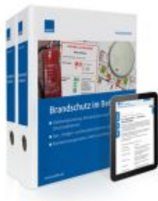
Brandschutz im Betrieb Ladenpreis: 207,90 EUR