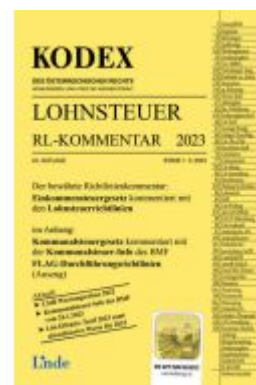
KODEX Lohnsteuer Richtlinien-Kommentar 2023 Ladenpreis: 62,00EUR