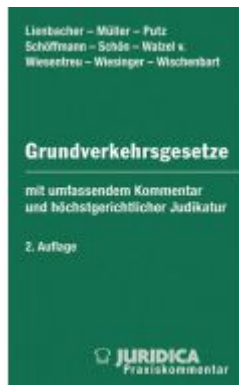
Die Grundverkehrsgesetze der österreichischen Bundesländer Ladenpreis: 225,00 EUR