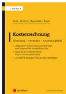
Kostenrechnung Ladenpreis: 48,00EUR