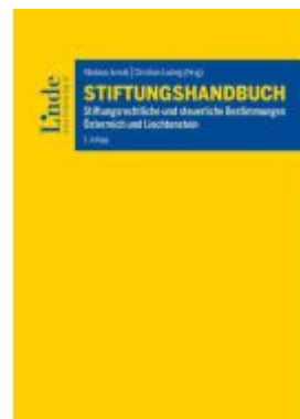
Stiftungshandbuch Ladenpreis: 110,00EUR