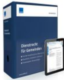
Dienstrecht für Gemeinden Ladenpreis: 228,90 EUR