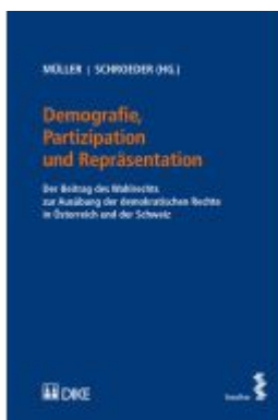
Demografie, Partizipation und Repräsentation Ladenpreis: 36,00EUR