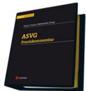
ASVG Praxiskommentar Ladenpreis: 315,00 EUR