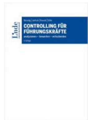
Controlling für Führungskräfte Ladenpreis: 68,00 EUR