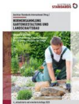
Normensammlung Gartengestaltung und Landschaftsbau Ladenpreis: 361,90 EUR