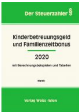
Kinderbetreuungsgeld und Familienzeitbonus 2020 Ladenpreis: 33,00 EUR