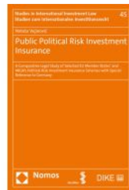
Public Political Risk Investment Insurance Ladenpreis: 412,90EUR