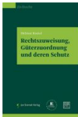
Rechtszuweisung, Güterzuordnung und deren Schutz Ladenpreis: 78,00EUR