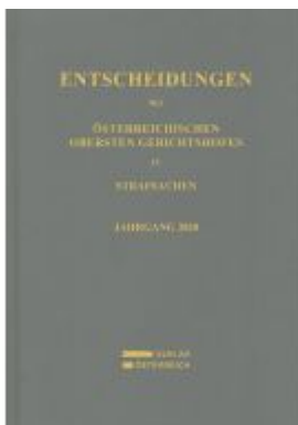
Entscheidungen des Österreichischen Obersten Gerichtshofes in Strafsachen Ladenpreis: 128,00EUR