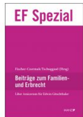
Liber Amicorum Edwin Gitschthaler Ladenpreis: 74,00 EUR