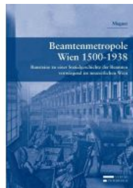
Beamtenmetropole Wien 1500-1938 Ladenpreis: 39,00 EUR