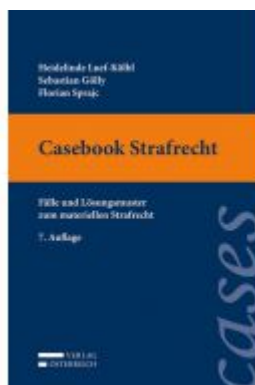
Casebook Strafrecht Ladenpreis: 36,00 EUR