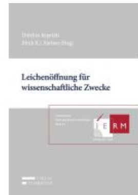
Leichenöffnung für wissenschaftliche Zwecke Ladenpreis: 58,00 EUR