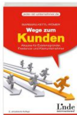
Wege zum Kunden Ladenpreis: 19,90 EUR