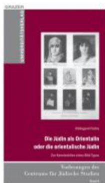
Die Jüdin als Orientalin oder die orientalische Jüdin Ladenpreis: 9,90 EUR