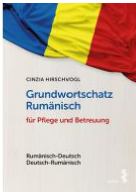
Grundwortschatz Rumänisch für Pflege und Betreuung Ladenpreis: 18,90 EUR

Wir haben andere Produkte gefunden, die Ihnen gefallen könnten!