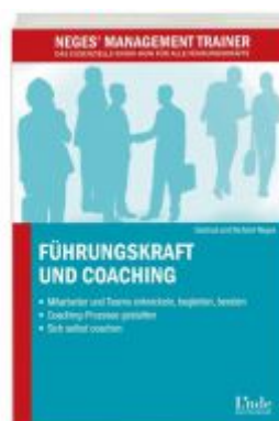
Führungskraft und Coaching Ladenpreis: 15,40 EUR