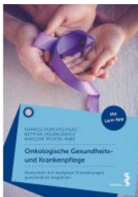
Onkologische Gesundheits- und Krankenpflege Ladenpreis: 24,90 EUR