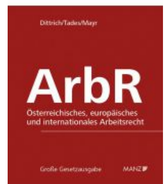
Arbeitsrecht Ladenpreis: 338,00 EUR