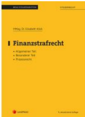
Finanzstrafrecht (Skriptum) Ladenpreis: 28,75EUR