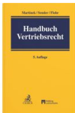
Handbuch Vertriebsrecht Ladenpreis: 299,00EUR