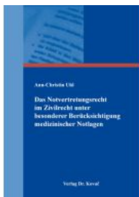
Das Notvertretungsrecht im Zivilrecht unter besonderer Berücksichtigung medizinischer Notlagen Ladenpreis: 101,60EUR