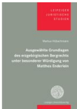
Ausgewählte Grundlagen des erzegebirgischen Bergrechts unter besonderer Würdigung von Matthes Enderlein Ladenpreis: 37,10EUR