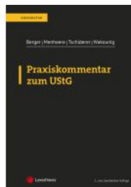
Praxiskommentar zum UStG Ladenpreis: 187,00EUR