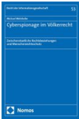
Cyberspionage im Völkerrecht Ladenpreis: 101,80EUR