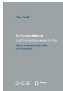
Rechtsproduktion und Technikwissenschaften Ladenpreis: 133,70EUR