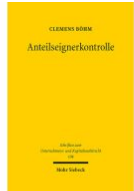
Anteilseignerkontrolle Ladenpreis: 117,20EUR