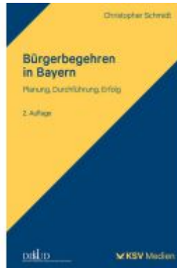
Bürgerbegehren in Bayern Ladenpreis: 32,90EUR