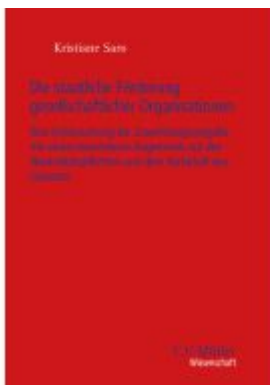
Die staatliche Förderung gesellschaftlicher Organisationen Ladenpreis: 91,50EUR