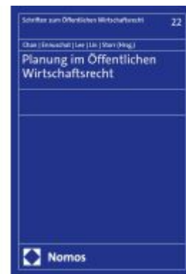
Planung im Öffentlichen Wirtschaftsrecht Ladenpreis: 65,80EUR