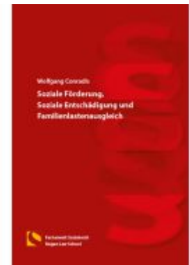
Soziale Förderung, Soziale Entschädigung und Familienlastenausgleich Ladenpreis: 29,80EUR