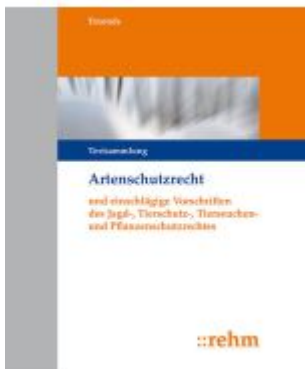
Artenschutzrecht (ArtSchR) Ladenpreis: 272,50EUR

Wir haben andere Produkte gefunden, die Ihnen gefallen könnten!