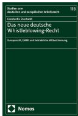
Das neue deutsche Whistleblowing-Recht Ladenpreis: 117,20EUR