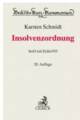
Insolvenzordnung Ladenpreis: 235,50EUR