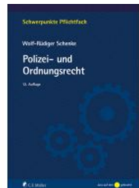
Polizei- und Ordnungsrecht Ladenpreis: 28,80EUR