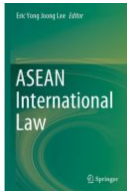
ASEAN International Law Ladenpreis: 219,99EUR