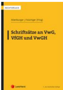
Schriftsätze an VwG, VfGH und VwGH Ladenpreis: 47,00EUR