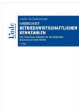
Handbuch der betriebswirtschaftlichen Kennzahlen Ladenpreis: 85,00 EUR

Wir haben andere Produkte gefunden, die Ihnen gefallen könnten!