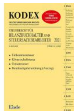
KODEX Steuerrecht für Bilanzbuchhalter und Steuersachbearbeiter 2021 Ladenpreis: 49,00 EUR