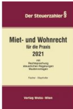
Miet- und Wohnrecht für die Praxis Ladenpreis: 69,30 EUR