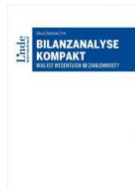
Bilanzanalyse kompakt Ladenpreis: 34,00 EUR