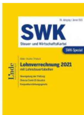
SWK-Spezial Lohnverrechnung 2021 Ladenpreis: 46,00 EUR