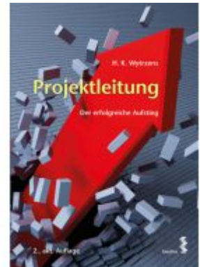
Projektleitung Ladenpreis: 32,00 EUR