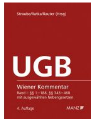
Wiener Kommentar zum UGB 4. Auflage Ladenpreis: 398,00EUR