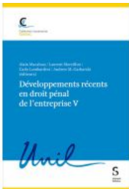
Développements récents en droit pénal de l'entreprise V Ladenpreis: 100,00EUR

Wir haben andere Produkte gefunden, die Ihnen gefallen könnten!