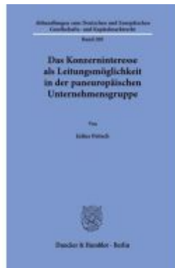
Das Konzerninteresse als Leitungsmöglichkeit in der paneuropäischen Unternehmensgruppe. Ladenpreis: 102,70EUR