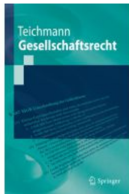
Gesellschaftsrecht Ladenpreis: 33,92EUR