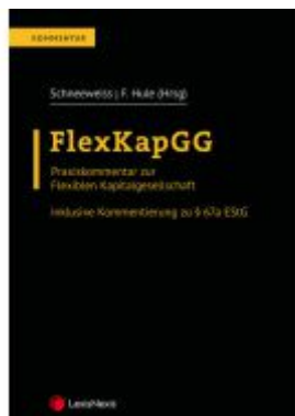
FlexKapGG Ladenpreis: 95,00EUR