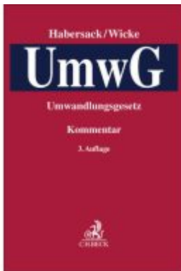
Umwandlungsgesetz Ladenpreis: 235,50EUR