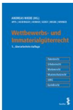
Wettbewerbs- und Immaterialgüterrecht Ladenpreis: 51,00EUR