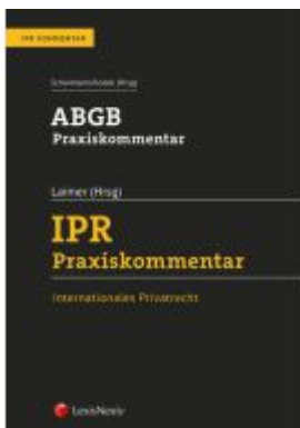
ABGB Praxiskommentar / IPR Praxiskommentar Ladenpreis: 360,00EUR