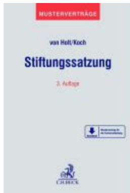
Stiftungssatzung Ladenpreis: 50,40EUR