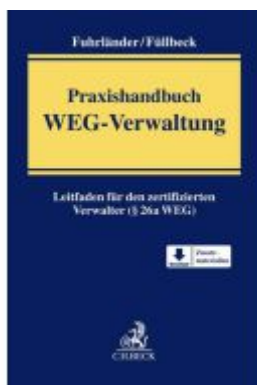
Praxishandbuch WEG-Verwaltung Ladenpreis: 81,30EUR