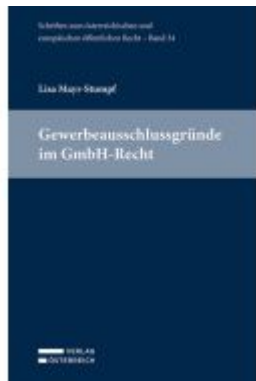
Gewerbeabschlussgründe im GmbH-Recht Ladenpreis: 84,00EUR

Wir haben andere Produkte gefunden, die Ihnen gefallen könnten!