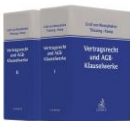
Vertragsrecht und AGB-Klauselwerke Ladenpreis: 204,60EUR