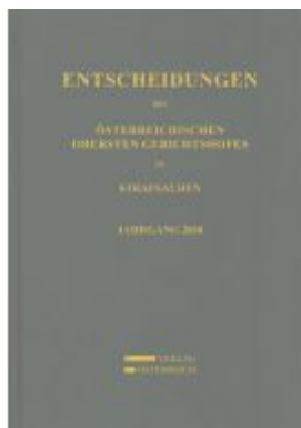
Entscheidungen des Österreichischen Obersten Gerichtshofes in Strafsachen Ladenpreis: 168,00 EUR