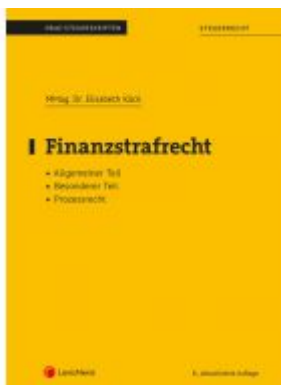
Finanzstrafrecht Ladenpreis: 23,00 EUR