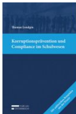
Korruptionsprävention und Compliance im Schulwesen Ladenpreis: 39,00 EUR