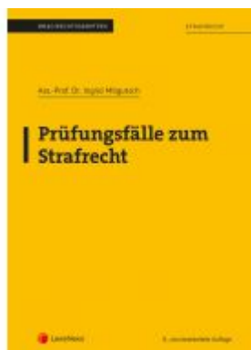
Strafrecht - Prüfungsfälle zum Strafrecht (Skriptum) Ladenpreis: 15,00 EUR