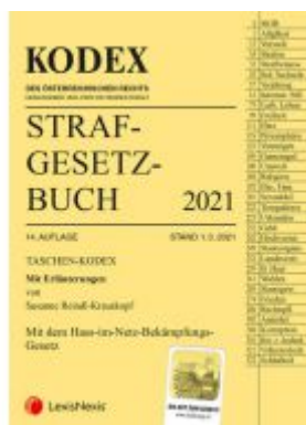
Taschen-Kodex Strafgesetzbuch 2021 Ladenpreis: 15,00 EUR