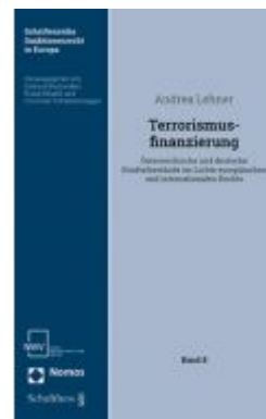
Terrorismusfinanzierung Ladenpreis: 68,00 EUR