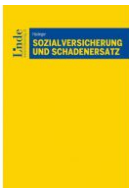
Sozialversicherung und Schadenersatz Ladenpreis: 32,00 EUR