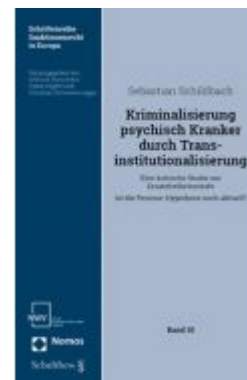
Kriminalisierung psychisch Kranker durch Transinstitutionalisierung Ladenpreis: 78,00 EUR