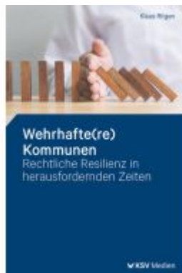
Wehrhafte(re) Kommunen Ladenpreis: 25,70EUR