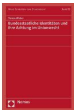
Bundesstaatliche Identitäten und ihre Achtung im Unionsrecht Ladenpreis: 142,90EUR