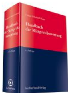
Handbuch der Mietpreisbewertung für Wohn- und Gewerberaum Ladenpreis: 102,80EUR