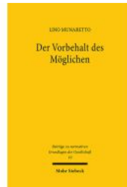
Der Vorbehalt des Möglichen Ladenpreis: 132,70EUR