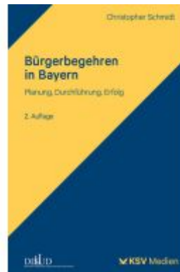
Bürgerbegehren in Bayern Ladenpreis: 32,90EUR