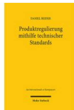
Produktregulierung mithilfe technischer Standards Ladenpreis: 96,70EUR