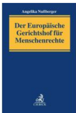
Der Europäische Gerichtshof für Menschenrechte Ladenpreis: 71,00EUR