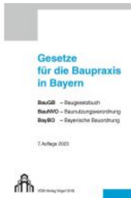
Gesetze für die Baupraxis in Bayern Ladenpreis: 22,50EUR