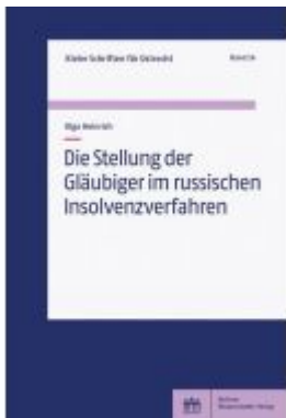
Die Stellung der Gläubiger im russischen Insolvenzverfahren Ladenpreis: 51,40EUR

Wir haben andere Produkte gefunden, die Ihnen gefallen könnten!