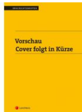
Strafrecht - Prüfungsfälle zum Strafrecht (Skriptum) Ladenpreis: 15,00 EUR