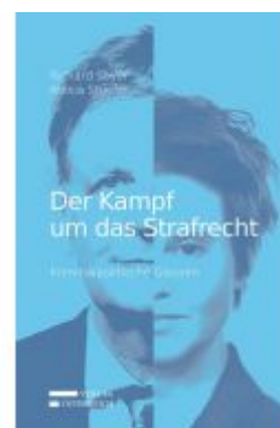
Der Kampf um das Strafrecht Ladenpreis: 25,00 EUR