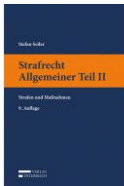
Strafrecht Allgemeiner Teil II Ladenpreis: 23,00 EUR