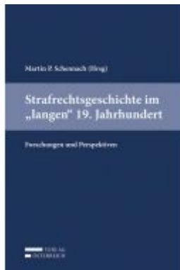
Strafrechtsgeschichte im "langen" 19. Jahrhundert Ladenpreis: 69,00 EUR