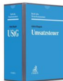
Umsatzsteuergesetz Ladenpreis: 91,50EUR