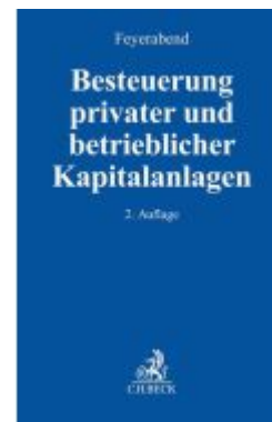
Besteuerung privater und betrieblicher Kapitalanlagen Ladenpreis: 153,20EUR