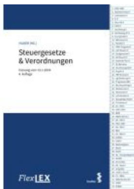
FlexLex Steuergesetze & Verordnungen Ladenpreis: 38,00EUR