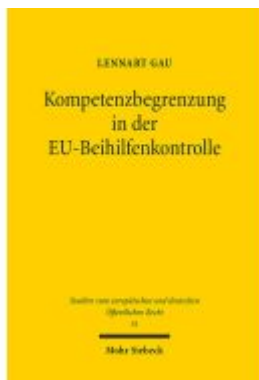
Kompetenzbegrenzung in der EU-Beihilfenkontrolle Ladenpreis: 107,00EUR