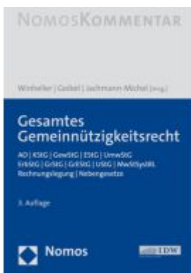
Gesamtes Gemeinnützigkeitsrecht Ladenpreis: 204,60EUR