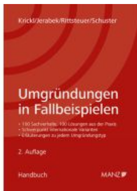
Umgründungen in Fallbeispielen Ladenpreis: 74,00EUR