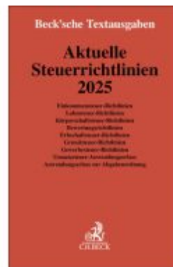
Aktuelle Steuerrichtlinien 2025 Ladenpreis: 23,60EUR