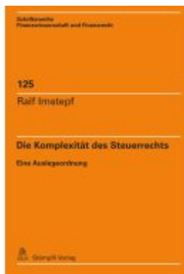
Die Komplexität des Steuerrechts Ladenpreis: 111,80EUR