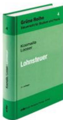
Lohnsteuer Ladenpreis: 60,70EUR