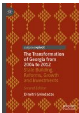
The Transformation of Georgia from 2004 to 2012 Ladenpreis: 54,99EUR