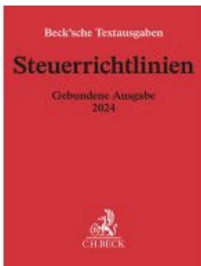
Steuerrichtlinien Gebundene Ausgabe 2024 Ladenpreis: 60,70EUR