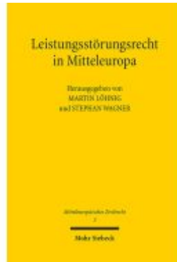
Leistungsstörungenrecht in Mitteleuropa Ladenpreis: 81,30EUR