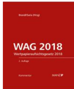
WAG 2018 2.Auflage Ladenpreis: 348,00EUR