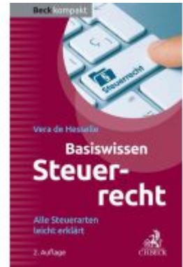
Basiswissen Steuerrecht Ladenpreis: 15,40EUR