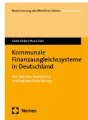
Kommunale Finanzausgleichssysteme in Deutschland Ladenpreis: 40,10EUR