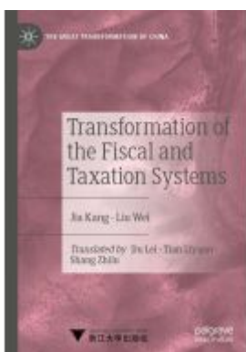
Transformation of the Fiscal and Taxation Systems Ladenpreis: 120,99EUR