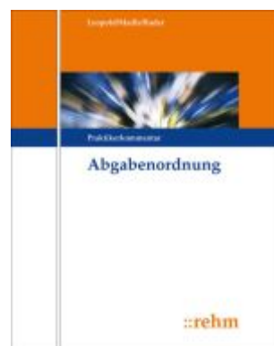
AO - Abgabenordnung Ladenpreis: 261,20EUR