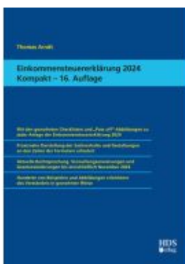
Einkommensteuererklärung 2024 Kompakt Ladenpreis: 58,50EUR