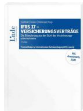
IFRS 17 - Versicherungsverträge Ladenpreis: 49,00 EUR