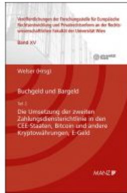
Buchgeld und Bargeld - Teil 2: Die Umsetzung der zweiten Zahlungsdiensterrichtlinie in den CEE- Staaten Ladenpreis: 64,00 EUR