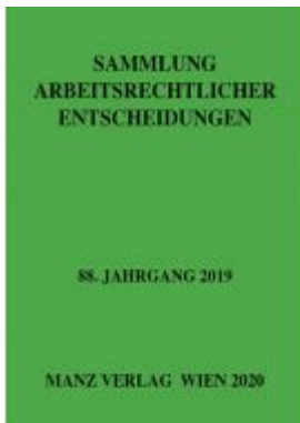
Sammlung arbeitsrechtlicher Entscheidungen Ladenpreis: 264,50 EUR