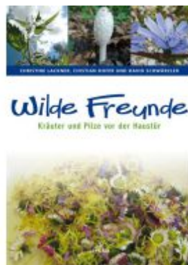
Wilde Freunde Ladenpreis: 14,90 EUR