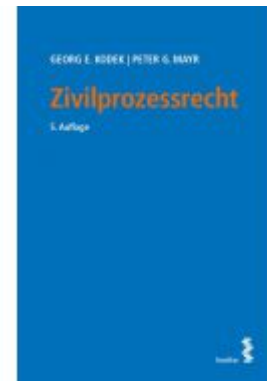
Zivilprozessrecht Ladenpreis: 39,00 EUR