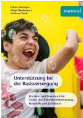
Unterstützung bei der Basisversorgung Ladenpreis: 22,90 EUR