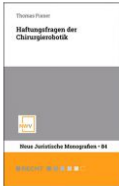
Haftungsfragen der Chirurgierobotik Ladenpreis: 54,00 EUR