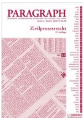
Paragraph - Zivilprozessrecht Ladenpreis: 16,90 EUR