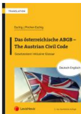
Das österreichische ABGB - The Austrian Civil Code Ladenpreis: 79,00 EUR