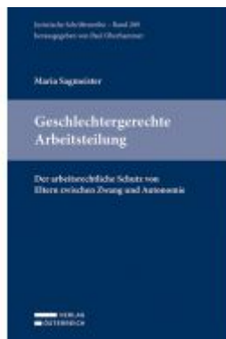
Geschlechtergerechte Arbeitsteilung Ladenpreis: 69,00 EUR