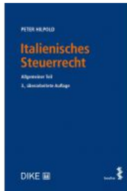
Italienisches Steuerrecht Ladenpreis: 38,00 EUR