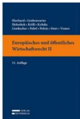
Europäisches und öffentliches Wirtschaftsrecht II Ladenpreis: 39,00 EUR

Wir haben andere Produkte gefunden, die Ihnen gefallen könnten!