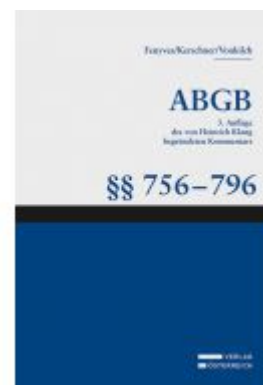
Großkommentar zum ABGB - Klang Kommentar Ladenpreis: 138,00 EUR