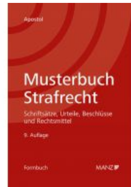
Musterbuch Strafrecht Ladenpreis: 108,00 EUR