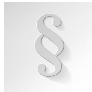
Besonderes Verwaltungsrecht Ladenpreis: 39,00 EUR