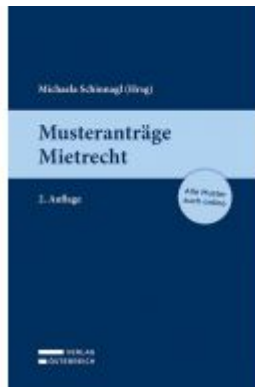
Musteranträge Mietrecht Ladenpreis: 59,00 EUR