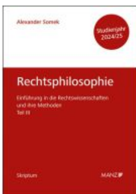
Rechtsphilosophie Einführung in die Rechtswissenschaften und ihre Methoden: Teil III Ladenpreis: 15,90EUR