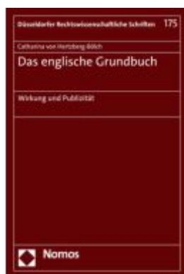
Das englische Grundbuch Ladenpreis: 55,60EUR