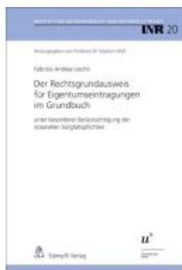
Der Rechtsgrundausweis für Eigentumseintragungen im Grundbuch Ladenpreis: 108,20EUR