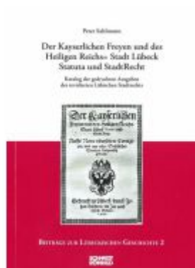
Der Kayserlichen Freyen und des Heiligen Reichs=Stadt Lübeck Statuta und StadtRecht Ladenpreis: 10,20EUR