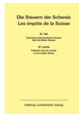
Die Steuern der Schweiz: Teil IV EL 193 Ladenpreis: 301,00EUR