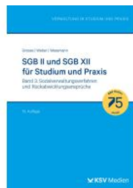
SGB II und SGB XII für Studium und Praxis (Bd. 3/3) Ladenpreis: 41,20EUR