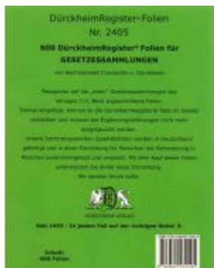
600 DürckheimRegister®-FOLIEN für STEUERGESETZE u.a.; zum Einheften und Unterteilen der Gesetzessammlungen Ladenpreis: 45,00EUR