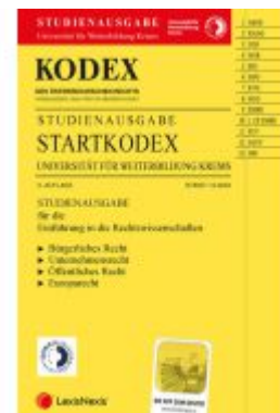
KODEX Startkodex Krens 2024/25 - inkl. App Ladenpreis: 28,00EUR