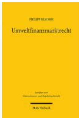
Umweltfinanzmarktrecht Ladenpreis: 122,40EUR