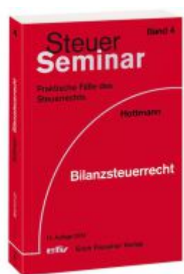
Bilanzsteuerrecht Ladenpreis: 44,30EUR