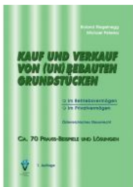
Kauf und Verkauf von (un)bebauten Grundstücken Ladenpreis: 38,50EUR