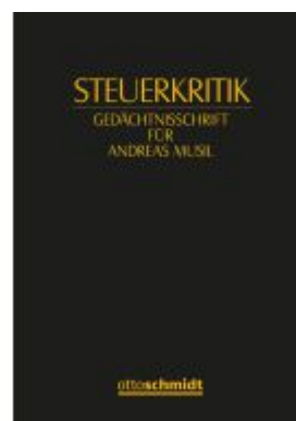
Steuerkritik Ladenpreis: 256,00EUR