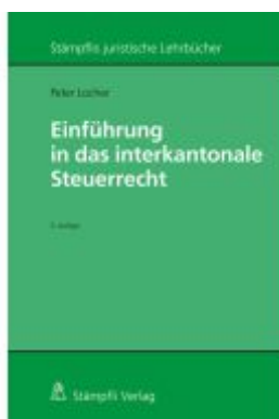
Einführung in das interkantonale Steuerrecht Ladenpreis: 128,20EUR