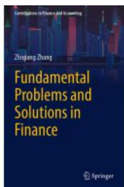
Fundamental Problems and Solutions in Finance Ladenpreis: 142,99EUR