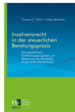
Insolvenzrecht in der steuerlichen Beratungspraxis Ladenpreis: 92,50EUR