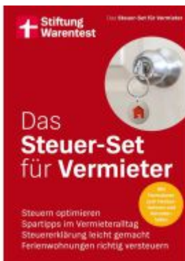
Das Steuer-Set für Vermieter Ladenpreis: 17,40EUR

Wir haben andere Produkte gefunden, die Ihnen gefallen könnten!