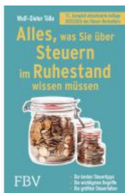
Alles, was Sie über Steuern im Ruhestand wissen müssen Ladenpreis: 10,30EUR