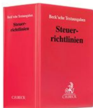
Steuerrichtlinien Ladenpreis: 71,00EUR