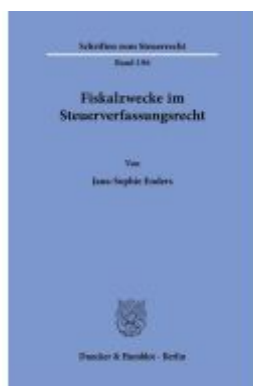
Fiskalzwecke im Steuerfassungsrecht. Ladenpreis: 113,00EUR