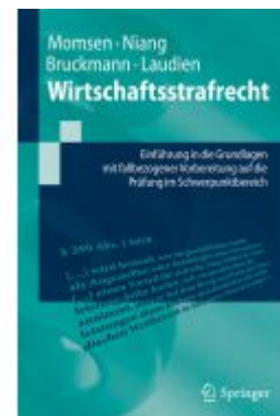
Wirtschaftsstrafrecht Ladenpreis: 30,83EUR