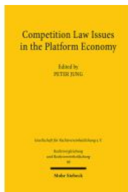
Competition Law Issues in the Platform Economy Ladenpreis: 60,70EUR