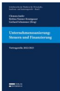
Vortragsreihe 2022/2023 Ladenpreis: 39,00EUR