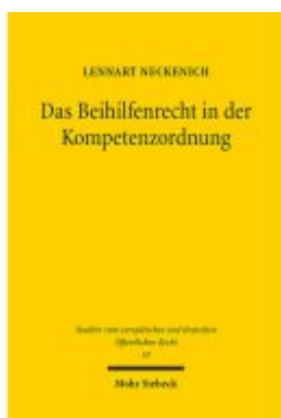
Das Beihilfenrecht in der Kompetenzordnung Ladenpreis: 96,70EUR